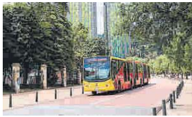
El GEB le apuesta a la movilidad sostenible, promoviendo el uso del gas natural en el transporte para disminuir la contaminación del aire.

Además de seguir con transmisión de energía y transporte de gas natural, el acuerdo con Enel le permitirá al Grupo Energía Bogotá incursionar en energías renovables no convencionales y desarrollar negocios para las ciudades inteligentes.