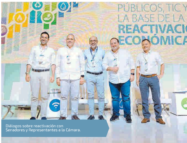
Diálogos sobre reactivación con Senadores y Representantes a la Cámara.