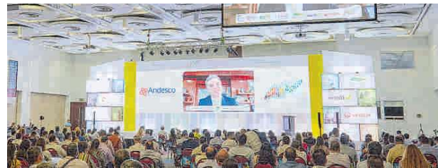
Carlos Eduardo Correa, Ministro de Ambiente.

Grandes apuestas se centran en el sector de servicios públicos domiciliarios: transición energética, movilidad sostenible, electrificación de la economía, eficiencia energética, el aprovechamiento de biomasa y biogás a partir de residuos sólidos, entre otros. El ministro