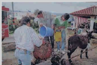
La crisis del agua en Tunja se superó gracias a la experiencia de Veolia, operador especializado en la prestación de servicios esenciales.