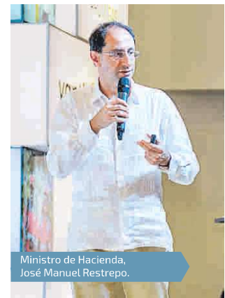
Ministro de Hacienda, José Manuel Restrepo.