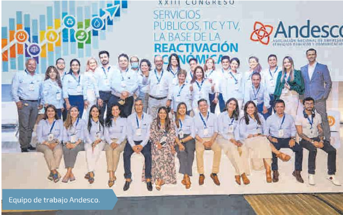
Equipo de trabajo Andesco.