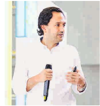
Diego Mesa, Ministro de Minas y Energía.

La UPME anunció la revisión de los horizontes de planeación con apuestas para la expansión de ambos servicios;