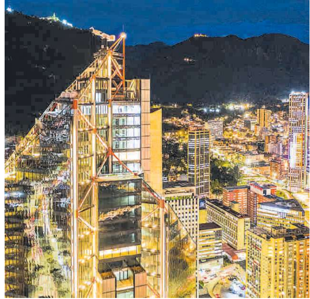
El desarrollo de proyectos para las ciudades inteligentes es uno de los objetivos del Grupo Energía Bogotá

Adicionalmente, en ciudades inteligentes el GEB trabaja en autogeneración con energía solar en los colegios del distrito capital y en entidades públicas, lo que permitirá reducir el valor de la factura y contribuir a la reducción de emisiones.