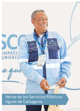
Héroe de los Servicios Públicos, Aguas de Cartagena.