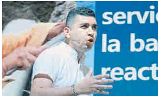
Jonathan Malagón, Ministro de Vivienda.