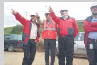
Uno de los proyectos con el que se seguirá garantizando la prestación del servicio en Tunja será la nueva fuente de abastecimiento.

a seguir brindando servicios de calidad para la capital boyacense, una ciudad que, orgullosa de su historia, ha crecido y se ha convertido en una ciudad resiliente, moderna y sostenible, referente en Colombia de la prestación de los servicios de agua potable, alcantarillado sanitario y tratamiento de aguas servidas.